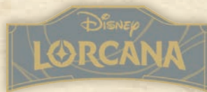
Spilla con logo Disney Lorcana