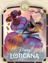
Spilla Sceriffo di Nottingham – Funzionario Corrotto