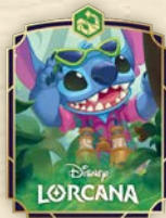
Spilla Stictch – Agente in Incognito