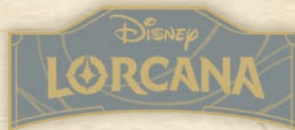
Disney Lorcana Logo-Pin