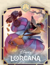
„Sheriff von Nottingham – Korrupter Beamter“ Promo-Pin