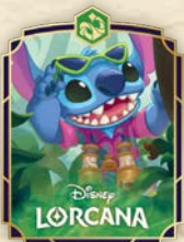
„Stitch – Verdeckter Ermittler“ Promo-Pin